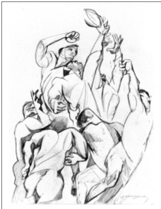
FIGURA 8.- La touche. 1966. Pluma y tinta china sobre papel