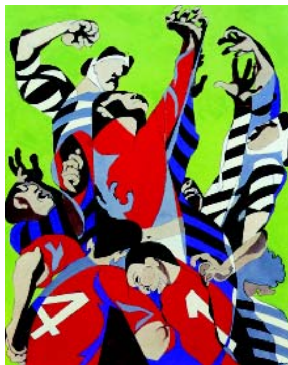
FIGURA 7.- Toma de balón. 1970. Óleo sobre tela

tico importante marcado por el expresionismo alemán, obteniendo en 1946 el Premio Nacional de pintura. Sin embargo, pronto verá anulado en parte su éxito, a causa de dedicar su producción al "realismo socialista" y al "arte de partido". Dentro de esta pintura comprometida, tuvo un cierto relieve en 1948 su obra " Les Parisiennes au marché " (Los Parisinos en el mercado), en la cual figuraban una viuda, un inválido de guerra, un obrero con el torso desnudo, una niña enfermiza y un manco por accidente de trabajo. Sin dejar su militancia política, a pesar de algunas peripecias ideológicas con fracciones de ideología ortodoxa, siguió su actividad pictórica hasta 1998 año en que falleció, dejando una amplia obra de óleos, acuarelas, dibujos, litografías y mosaicos-cerámicas, presente en numerosos museos (de París a New York, pasando por Moscú).