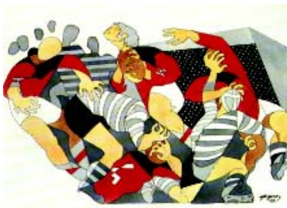
FIGURA 2.- Penetración. 1971. Acuarela sobre papel

por el Frente Popular y las luchas contra el fascismo. Militó en el movimiento de La Maison de Culture (La Casa de Cultura), dirigida por el líder comunista Louis Aragon. En 1937, el escritor Jean Cassou le propuso figurar en la exposición denominada l'Art Cruel (el Arte Cruel), muy relacionada con la Guerra Civil española. Después de dudar en alistarse en las Brigadas Internacionales, Fougeron consideró que su papel era más efectivo otorgando su testimonio a través de la pintura y participó en la muestra con dos telas que alcanzaron gran notoriedad: " Espagne martire " (España mártir) y " Mort et faim, Espagne " (Muerte y hambre, España), ambas de clara inspiración picassiana (recordemos que en el pabellón español de la Exposición Internacional de París de aquel mismo año, figuraba en lugar preeminente el célebre Guernica). En 1939, se adhiere al Partido Comunista.