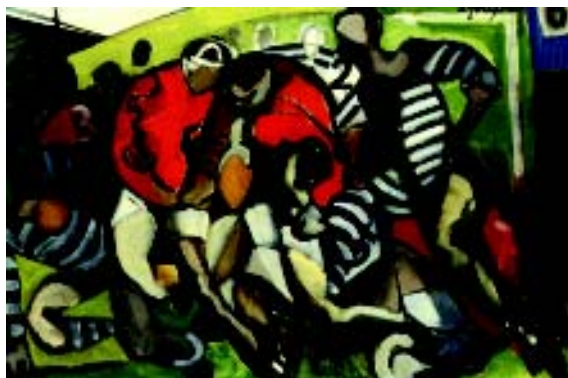
FIGURA 1.- Salida de méléé. 1965-1966. Óleo sobre tela