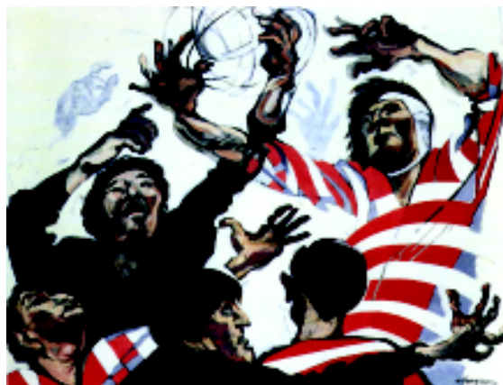
FIGURA 3.- Enfrentamiento rojo y negro. Óleo sobre tela

Durante la Guerra Mundial cae prisionero en Bélgica aunque logra reinstalarse en París, donde transforma su taller en imprenta clandestina. En la posguerra, ocupa un lugar artís-