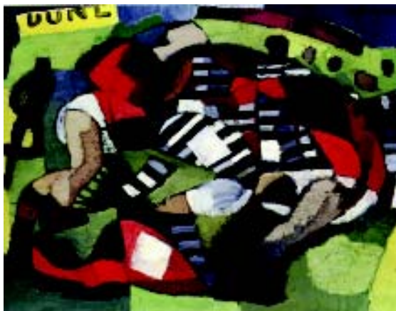
FIGURA 9.- El estadio. 1965- 1966. Óleo sobre tela