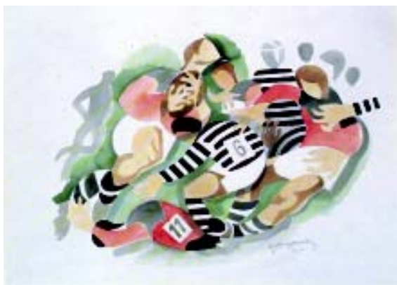
FIGURA 4.- Placage. 1965. Acuarela sobre papel