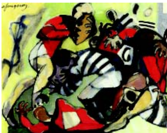
FIGURA 5.- Juego a la touche. 1965-1966. Óleo sobre tela